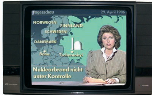
Tagesschau, Dienstag, 29. April 1986

„In dem sowjetischen Kernkraftwerk Tschernobyl ist es offenbar zu dem gefürchteten GAU gekommen, dem größten anzunehmenden Unfall.“ Tagesschau , 29. April 1986