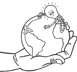
Schönauer Markenzeichen: Das Glühbirnen-Männchen

gen – man sieht sie nicht, man hört sie nicht, man riecht sie nicht. Aber sie ist unverkennbar in der Region angekommen. „Radioaktiver Niederschlag auch in Südbaden“ muss die Badische Zeitung am nächsten Tag vermelden. Es ist der 2. Mai, und es ist nichts mehr wie es war – in Schönau nicht, und auch sonst nirgends. Die Atomkraft hat spätestens jetzt ihre Unschuld verloren.