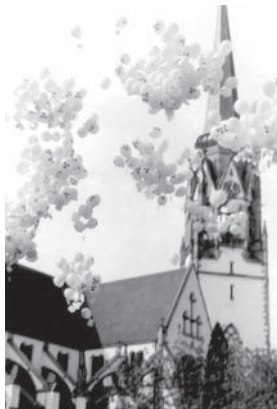
Zwei Jahre nach Tschernobyl: Schönauer Protest mit hunderten Luftballons

der Überschriften, die man in diesem Sommer in den Zeitungen liest. Und während sich die ersten Elterninitiativen in Deutschland mit der Urlaubszeit schon wieder auflösen, ist Tschernobyl in der Politik angekommen. Am 26. August beschließt die SPD auf ihrem Nürnberger Parteitag einen Ausstieg aus der Atomenergie innerhalb von zehn Jahren. So weichen Schock und Hilflosigkeit dem politischen Gestaltungswillen.