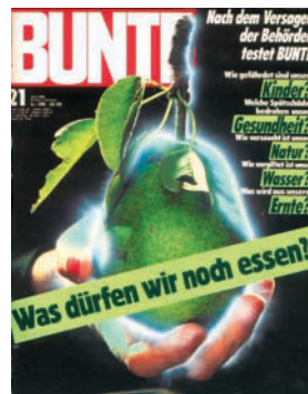
Ausgabe vom 15. Mai 1986