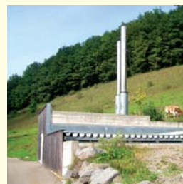
Solar Info Center, Photovoltaikanlage auf dem badenova-Stadiondach und Holz-Hackschnitzanlage in Oberried