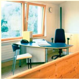
Solarturm der Richard-Fehrenbach-Gewerbeschule und Passivhaus

fesa e.V. und Regierungspräsidium Freiburg