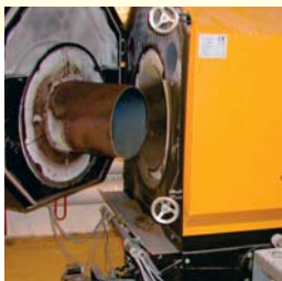
Holzpellettheizung im Hotel Victoria