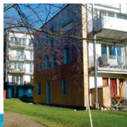
zeroHaus im Stadtteil Vauban