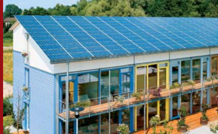
Plusenergiehaus in der Solarsiedlung